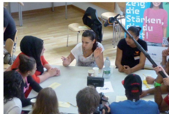
Ausbilderin im Gespräch mit Bewerberinnen

Die projektinterne wissenschaftliche Prozessbegleitung durch das ifm der Universität Mannheim konzentriert sich auf die im Projektverlauf auftauchenden steuerungsrelevanten Fragen