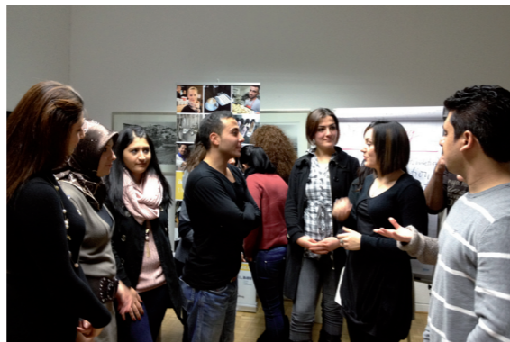
Azubi Tutoren diskutieren gemeinsam das weitere Vorgehen

Ausbildungsordner: Gemeinsam mit einem Unternehmen wurde ein betrieblicher Ausbildungsordner erstellt. Neben dem beruflichen Ausbildungsrahmenplan, einem Überblick über alle Lernziele und -inhalte umfasst der Ordner auch die betrieblichen Spezifika.